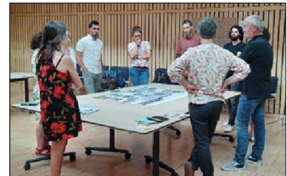
Atelier Mobilité des actifs en Cornouaille, le 21 juin 2023