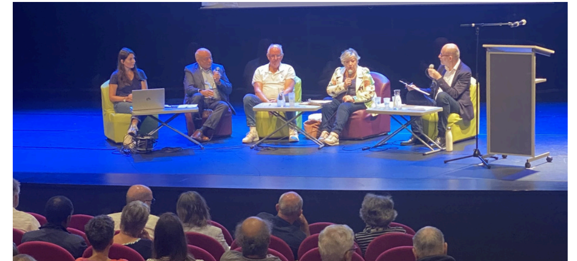
Rencontres mobilités durables du Pays de Brest, le 27 septembre 2023