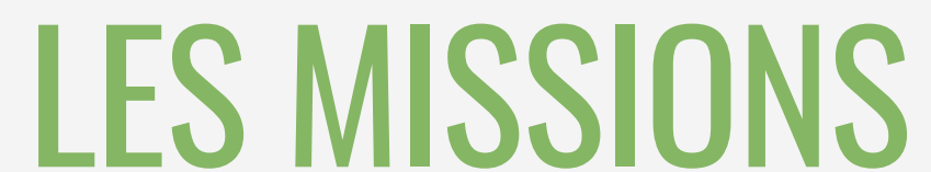
SCHÉMA DE COHÉRENCE OUEST CORNOUAILLE